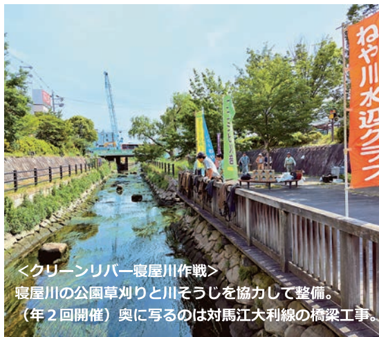
＜クリーンリバー寝屋川作戦＞ 寝屋川の公園草刈りと川そうじを協力して整備。 (年2回開催) 奥に写るのは対馬江大利線の橋梁工事。

【連絡先】寝屋川市御幸西町 25-14-301 TEL: 090-2554-3185 メールアドレス: sugako55@yc4.so-net.ne.jp