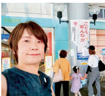
🌿 こどもまんなかフェス