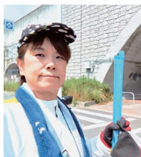
🌿 第二京阪道路清掃