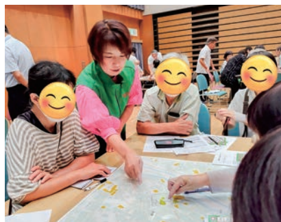
タウン DIG (マップ作り)