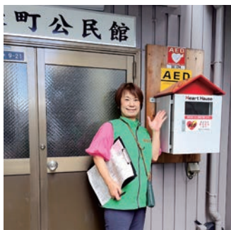
まち歩きで公民館 AED

<防災士活動> 各地域での防災活動に参画し「講習・まち歩き・防災マップ作り」など、いざという時に、ご自身や家族を守り、近隣の方との協力体制が大事なことを知っていただく活動を展開しています。