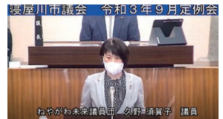
設計案反対のため討論に立つ

くなった総合センター機能の代替えを考えること。私からは、アルカスホールと並んで生涯学習エリア（貸会議室含む）とすることを一般質問にて提案しています。